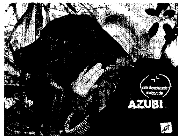
Noch ist Luna „Therapiehund in Ausbildung“, wie ihr Leibchen mit der Aufschrift „Azubi“ zeigt.